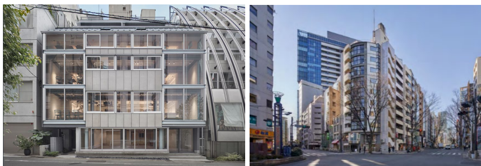
COERU 渋谷イースト(左)、COERU 渋谷道玄坂(右)

今後、築古とされるビルの増加が見込まれるなか、築年が経過している既存建物においても、再生建築により経済的耐用年数を延伸し、資産価値を大幅に向上させることで、社会課題にも取り組みます。