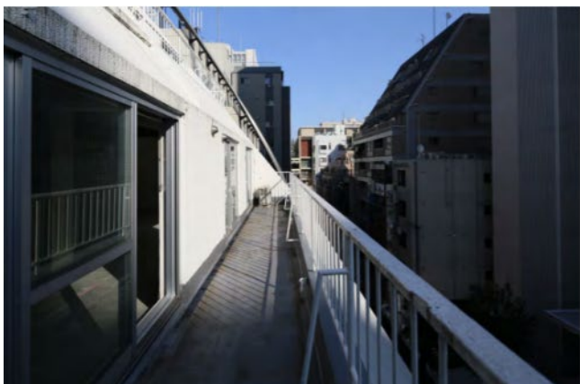
再生前（4階バルコニー）

・立地の優位性はあるものの、地域性を踏まえた改修内容とそれに即したリーシング戦略により、築50年超の物件ながら高水準の賃料を実現している点は評価できる。